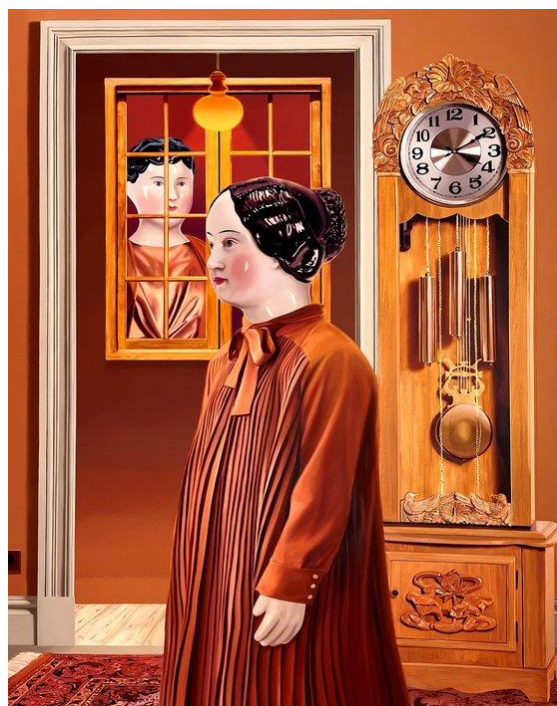
최지원, 평온함을 향하여 2024, oil on canvas, 227.3 x 181cm