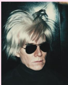
<SELF-PORTRAIT IN AFRIGHT WIG> 루이 비통 재단 미술관 컬렉션

마크 디온은 아마추어 생태학자이자 고고학자로서 전 세계를 탐험한다. 그의 국내 첫 개인전인 만큼, 한국의 해양 건강과 생물 종의 다양성을 주제로 한 대형 신작 설치 작품들이 최초로 공개된다. 자연을 향한 인간의 파괴적인 행위에 대한 분노와 애도 등 복합적인 감정을 담아내며 작가는 인간의 믿음이 무엇인지, 과연 그것은 진실한 것인지 질문을 던진다.