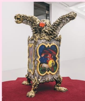
<한 목표를 노리는 세 영웅>