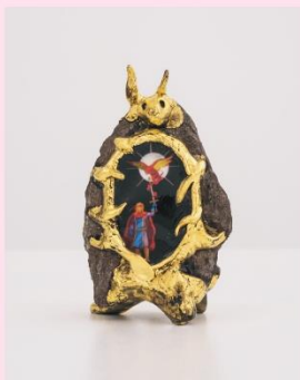
<검 위에 내려앉은 불시조> 129

대중문화를 활용한 다양한 작품으로 사회적 아이콘이 된 앤디 워홀. 그의 초기작부터 후반기까지 이르는 루이 비통 재단 미술관의 소장품을 선보이는 전시가 열린다. 전 생애에 걸쳐 영화와 텔레비전을 비롯한 매체, 언더그라운드 및 쿼어 문화 등 다채로운 영역에서 활동을 펼친 워홀에게 내재된 각양각색의 캐릭터와 스스로에 대한 성찰을 만나볼 수 있는 자리다.